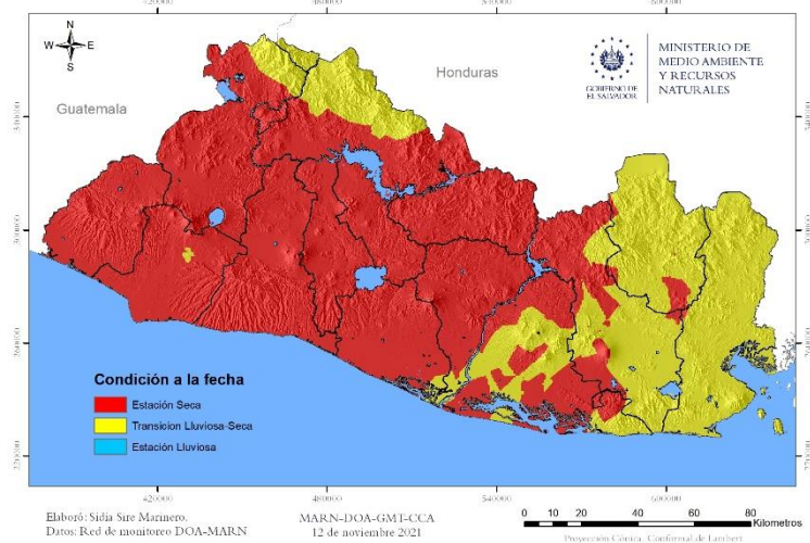
Figura 2 Mapa de la condición de transición lluviosa - seca 2021.