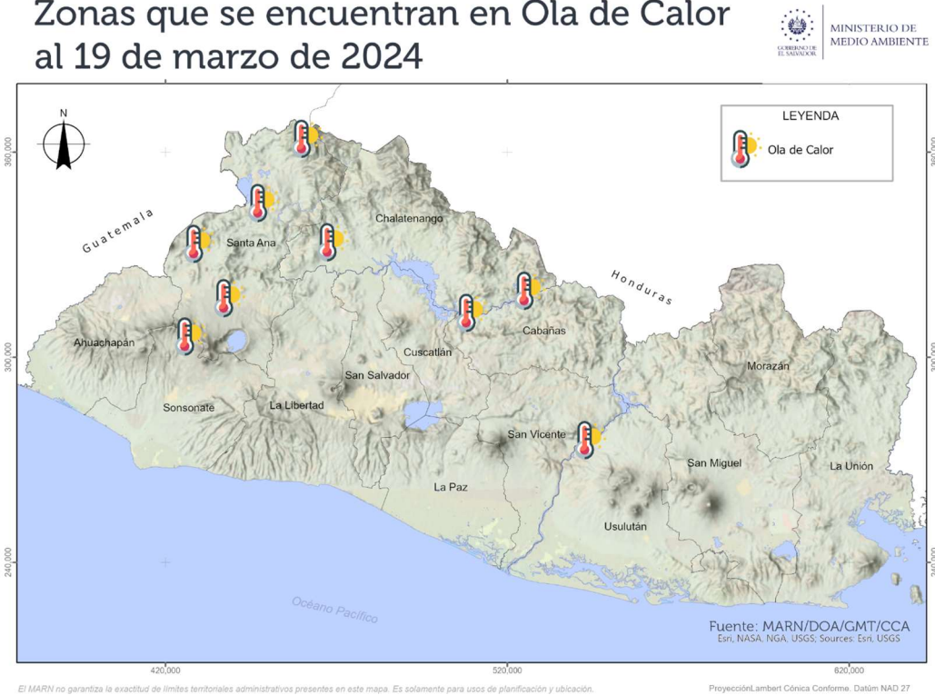
Mapa 1. Mapa de zonas con Ola de calor al 19 de marzo 2024.

El día 19 de marzo, los valores de temperatura máxima en el rango de los 38 °C a 40 °C se observan en los alrededores del cauce del río Lempa, en la mayor parte de la zona