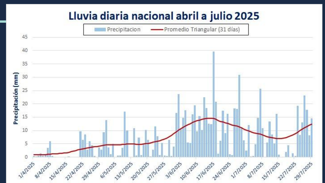
Gráfica 1. Comportamiento de la canícula.